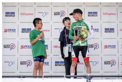
表彰プレゼンターのTOJキッズから選手へインタビュー

東京・大井ふ頭周回コース(104km)を舞台に、国内外16チームが集結。会場には大型ビジョンを設置し、協賛企業ブース、自転車教室、交通安全啓発イベント、著名人を招いたパレード走行などを展開し、来場者にエンターテインメントと教育的価値を併せて提供した。