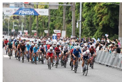
多くの観客が詰めかける東京ステージ