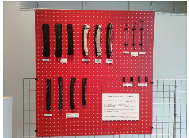
タイヤの劣化状態を比較して展示