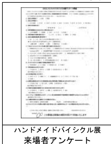
ハンドメイドバイシクル展 来場者アンケート