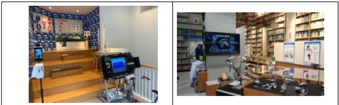
「自転車ふしぎ展～走る・曲がる・止まるの科学～」