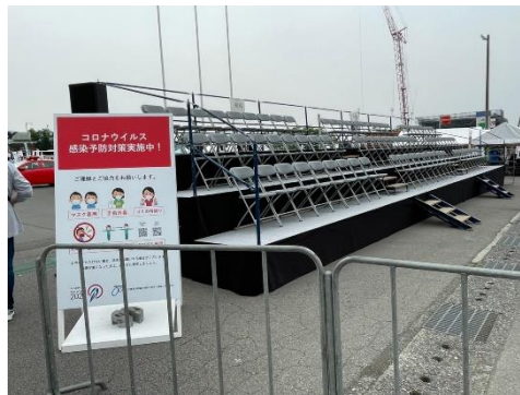
TOJ2022富士山ステージ観客用スタンド 席横に注意喚起看板設置