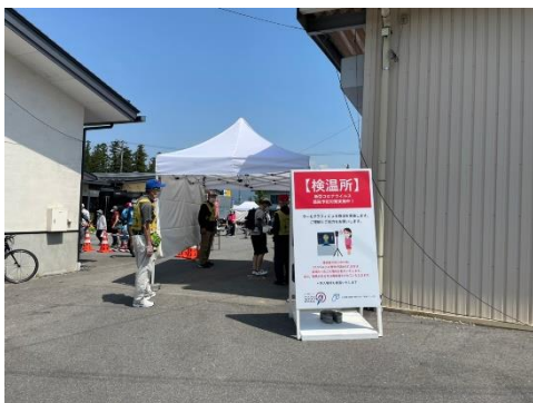
TOJ2022信州飯田ステージ検温所