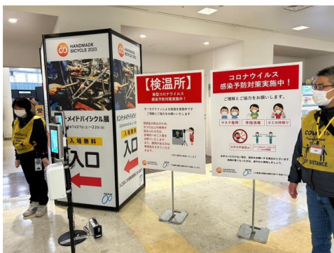
2023HMB入口検温場所と注意喚起看板