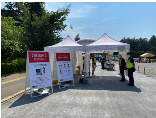
CDF2022検温所及び注意喚起看板