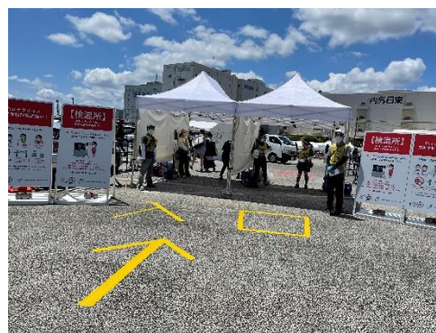
TOJ2022東京ステージ検温所・注意喚起看板