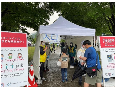
TOJ2022相模原ステージ検温所