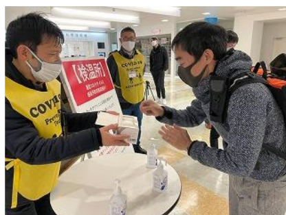
2022ハンドメイドバイシクル展 来場者への不織布マスク着用のお願い