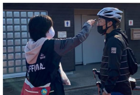
伊豆大島御神火ライド2021 参加者への検温の様子