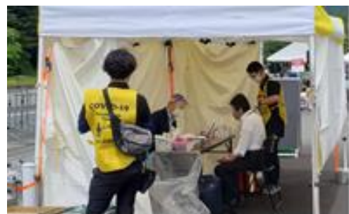
2021 Tour of Japan 検温所 再検温者への問診の様子