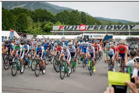
今年、富士山ステージのスタート地点に設定した富士スピードウェイ。

広報においては、昨年よりライブ配信媒体を変更し、スポーツ専門メディアであるSPORTSBULLでライブストリーミングを実施し、番組構成内容及び高画質な配信環境の向上が実現した。