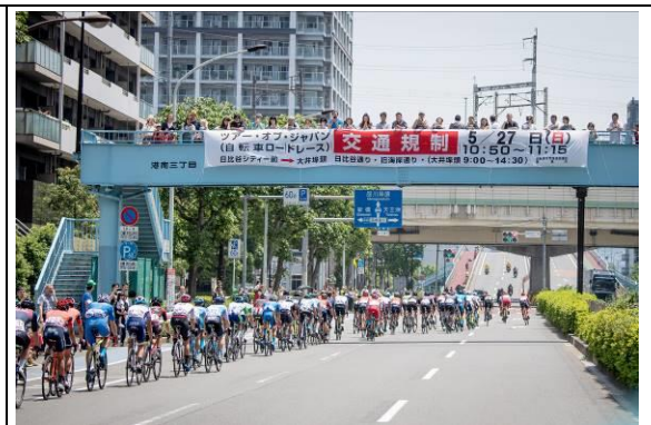
全ステージにおいて公道を交通規制して行うTOJ。東京ステージも毎年、警視庁の多大なる支援を受け、交通規制の横断幕を掲示して実施。