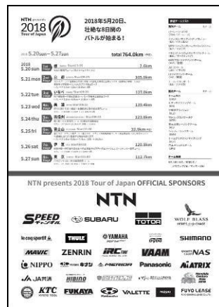
チラシ (表面)、ポスター