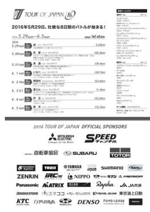
チラシ (表面)、ポスター