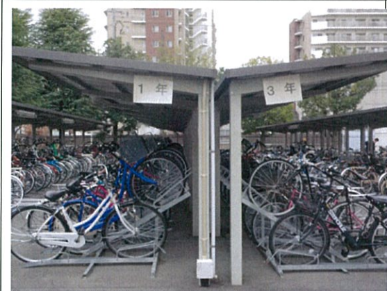
同上拡大(1年・3学年共用)