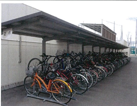
自転車駐輪場(2学年用)