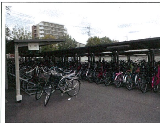
自転車駐輪場(全景)