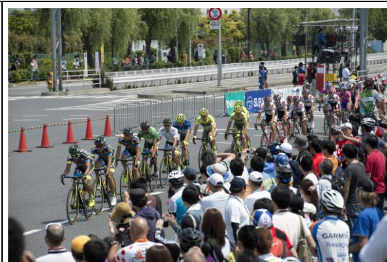
観戦者の多い中、東京ステージフィニッシュ地点を通過する選手。