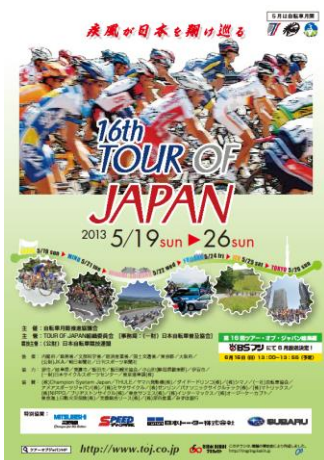
チラシ (表面)、ポスター