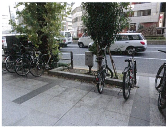
都道 408 号(G)