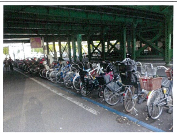
駐輪状況(一日利用エリア)②