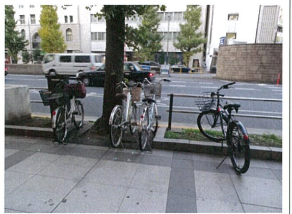
都道 408 号(2R)