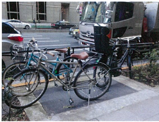
表示②C/通気口上の放置自転車