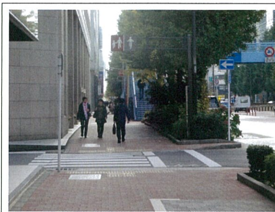
表示⑩/自転車通行帯