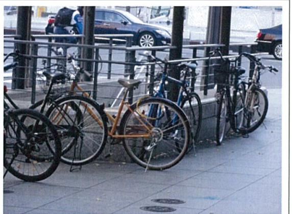
都道 404 号(l)