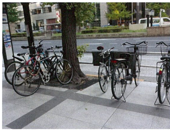
都道 408 号(E)