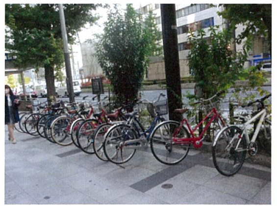
都道 408 号(F)