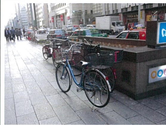
国道 15 号(2K)