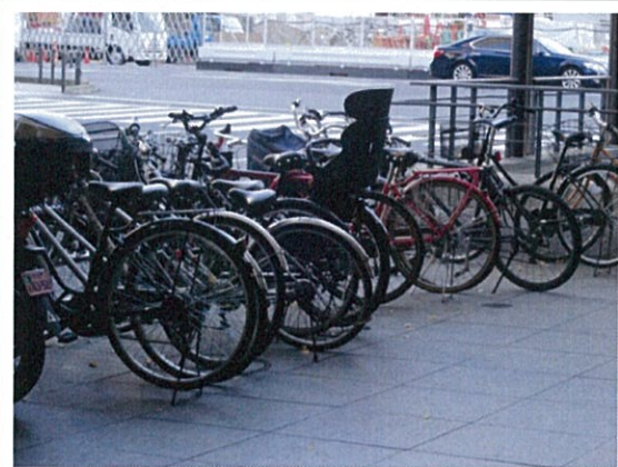
都道 404 号(k)