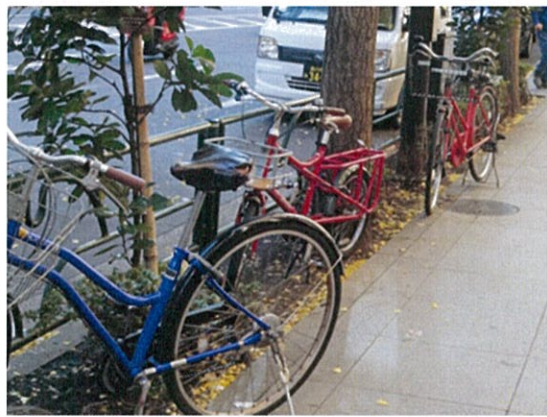
都道 407 号(d)