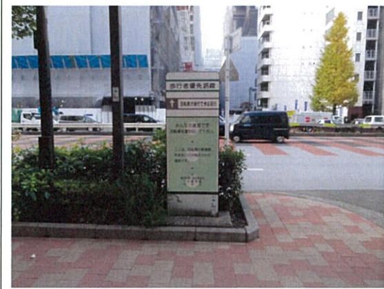
表示⑧/自転車マナー表示板