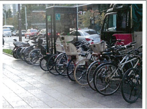
国道 15 号(2P)