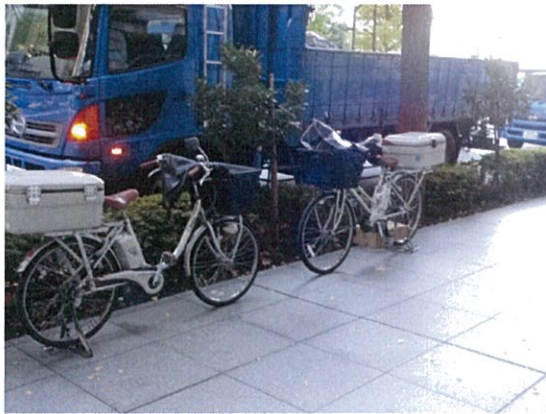
都道 407 号(U)