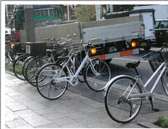
国道 15 号(2O)