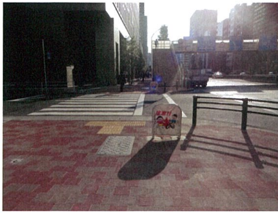
表示④/自転車マナー表示板