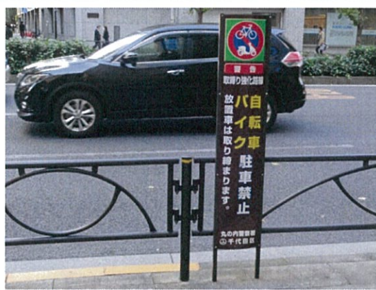
表示①/放置自転車禁止警告表示