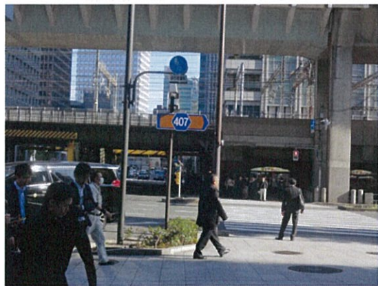
表示⑦/自転車マナー表示板