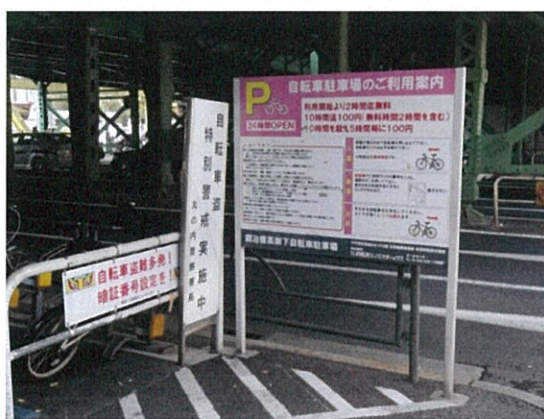
鍛冶橋高架下自転車駐車場