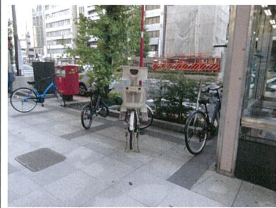
都道 408 号(2Q)