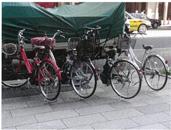
国道 15 号(I)