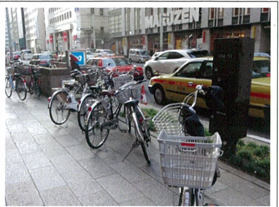
国道 15 号(2J)