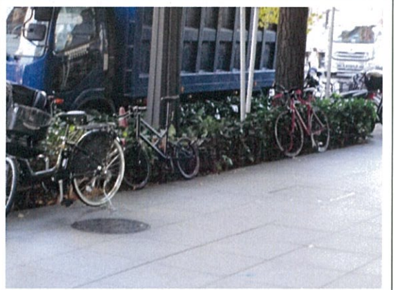
都道 404 号(j)