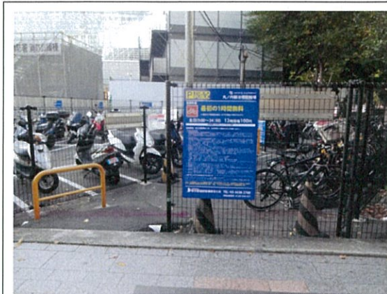
丸の内鍛冶橋駐輪場