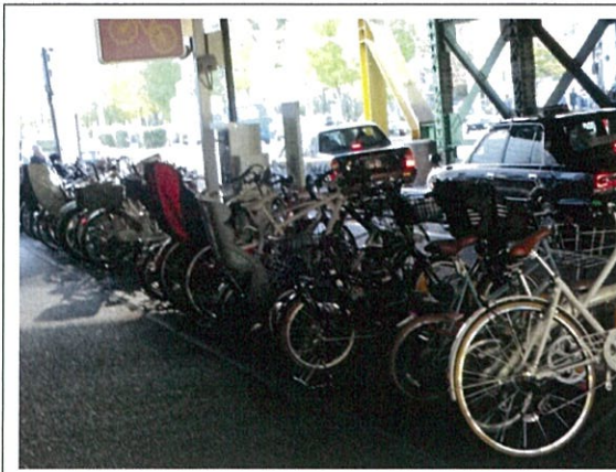
駐輪状況(一日利用エリア)①