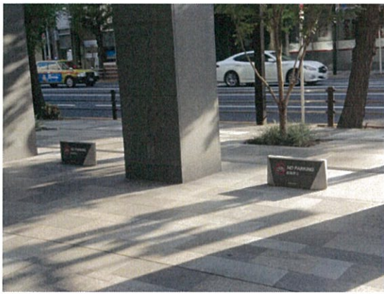
表示⑤/駐輪禁止板(民間)