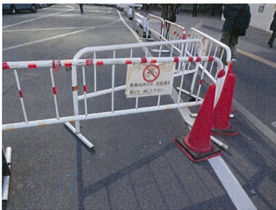
表示④/自転車下車促進表示