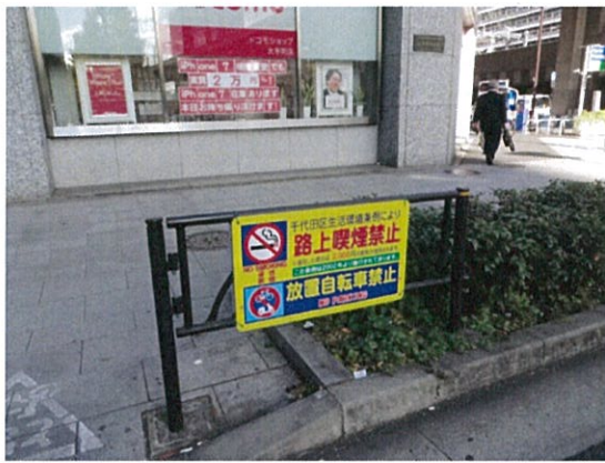
表示③/放置自転車禁止表示