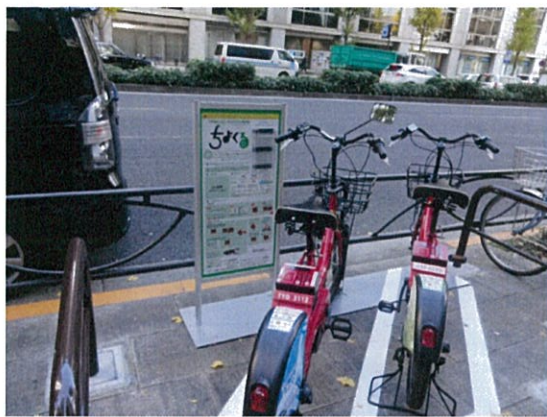
表示⑨/ちよくる(コミュニティサイクル/大手町)