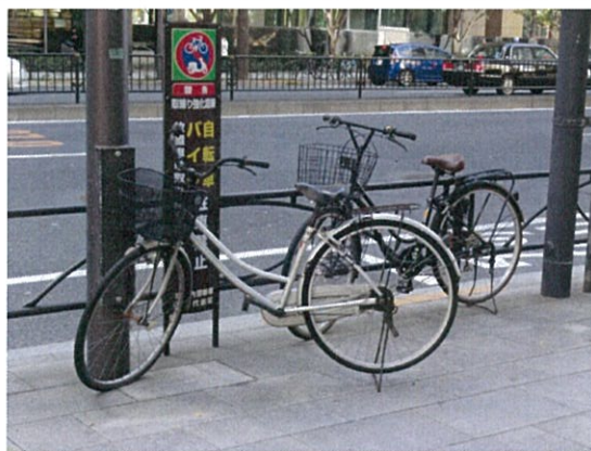
表示②A/放置自転車禁止警告表示上の放置自転車