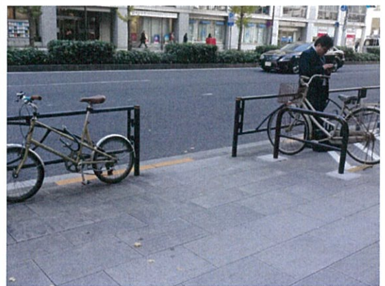
表示②B/ちよくる駐輪区域内の放置自転車(右側)