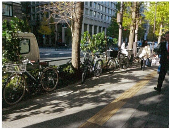
都道 407 号 (m)