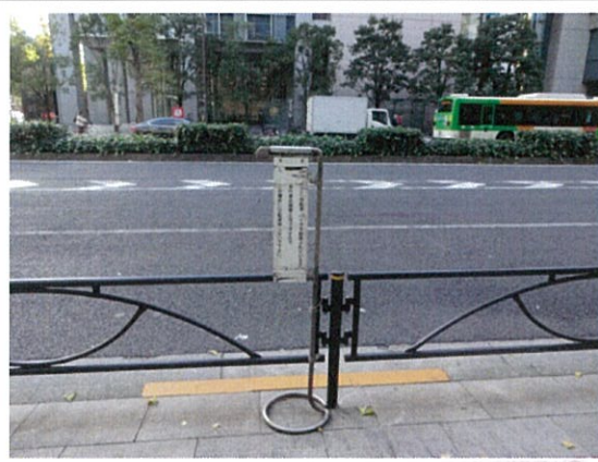
表示⑤/駐輪禁止表示