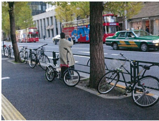
都道 407 号 (o)