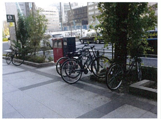
都道 408 号(H)