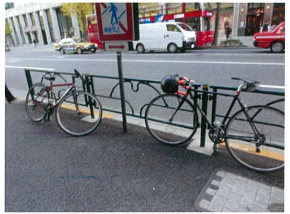
都道 407 号 (n)