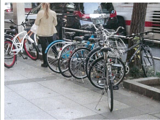
都道 408 号(2S)