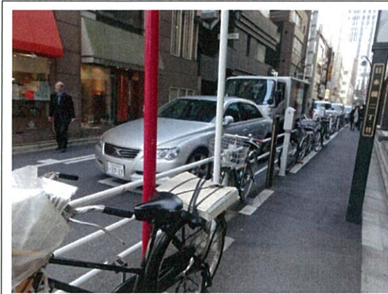
日本橋 2 丁目通り(K)