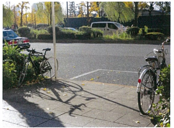
国道 1 号 (p)