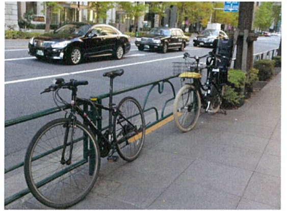
都道 407 号(b)