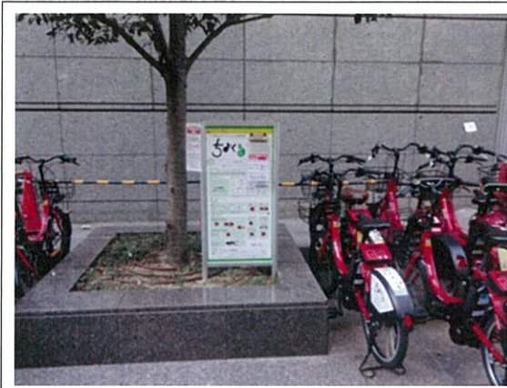
表示⑫/ちよくる(コミュニティサイクル/丸ビル)