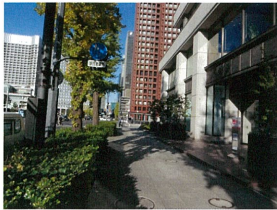
表示⑧/自転車マナー表示板