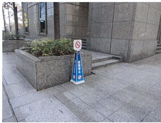
表示⑥/駐輪禁止表示(民間)