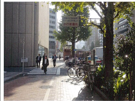
表示⑨/自転車マナー表示板