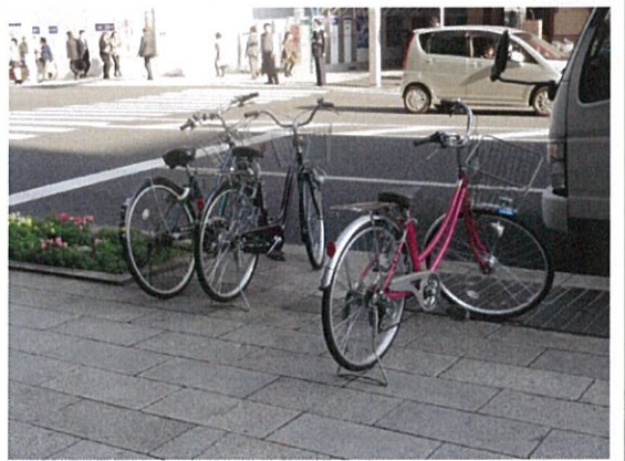
国道 15 号(J)