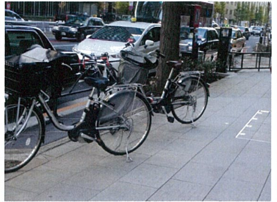
都道 407 号(t)