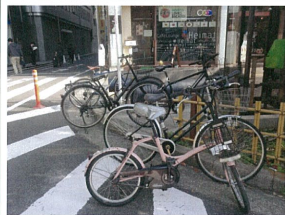
都道 408 号(C)