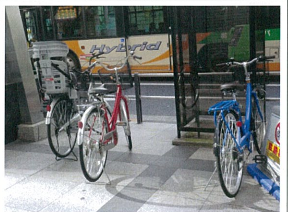
都道 408 号(D)