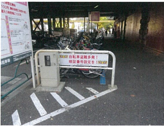
表示⑥/盗難防止警告板