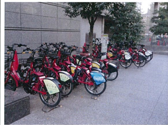
表示⑬/駐輪状況(全景)