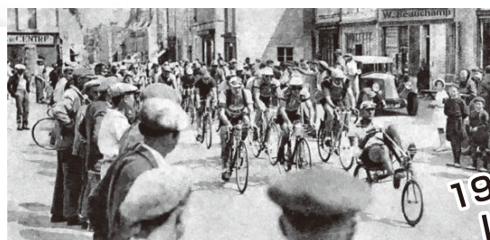
1930年代の レース風景

開催日: 2016年7月6日(水)～10月2日(日) ※月曜日は休館日です。(月曜日が祝・祭日の場合は翌平日が休館日)