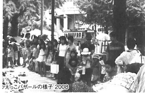
かえっこバザールの様子 2008