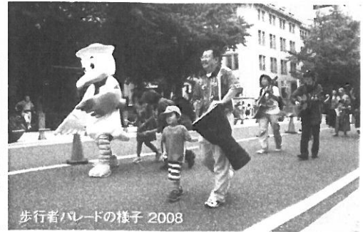
歩行者パレードの様子 2008