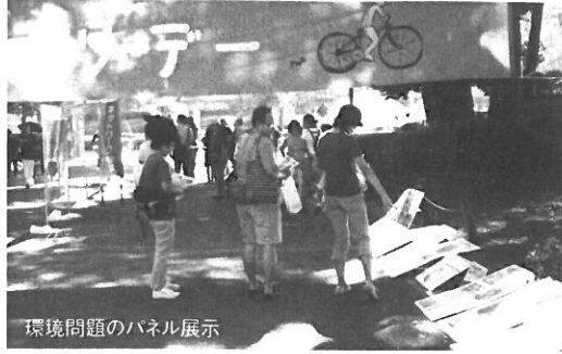
環境問題のパネル展示