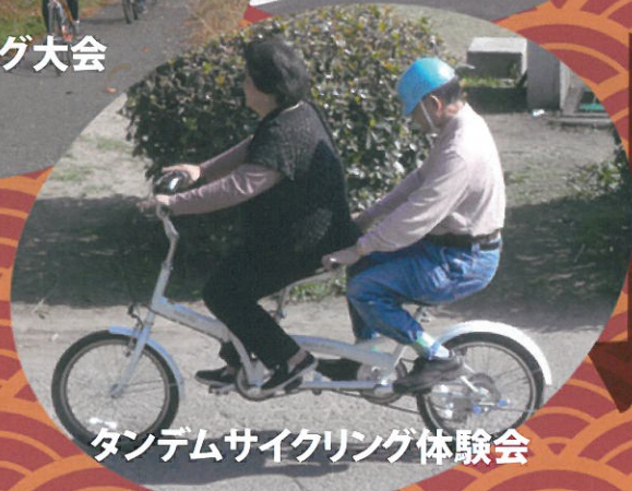
タンDEMサイクリング体験会