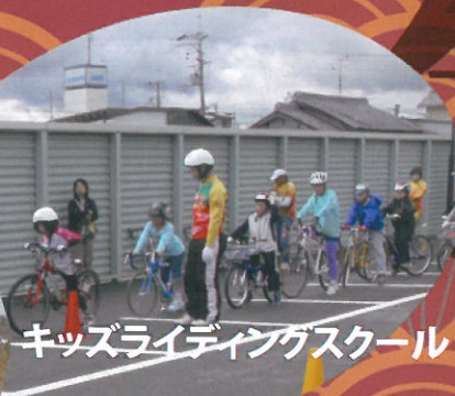
キッズライディングスクール