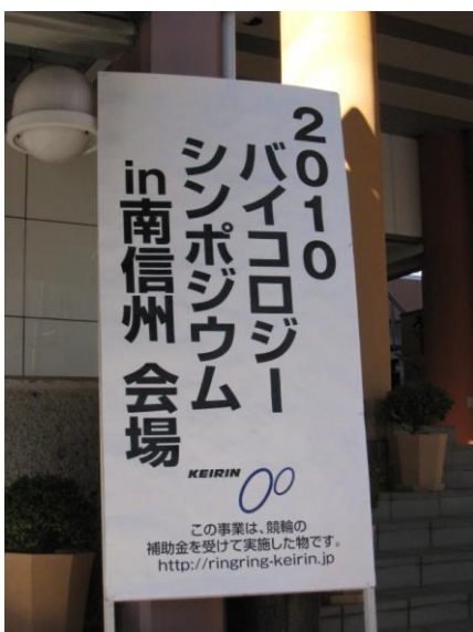
シンポジウム入口看板（シルクホテル）

また、TV・新聞の取材も多く、この模様は、2011年1月3日（月）BS-TBS 23:30～24:00「銀輪の風」で放送される予定です。