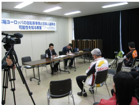
本場ヨーロッパのレース事情と日本人選手の可能性を知る教室