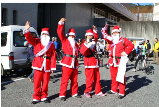
関連イベント／電動アシスト自転車でまちなか ポタリング（たすきでバイコロジーPR）