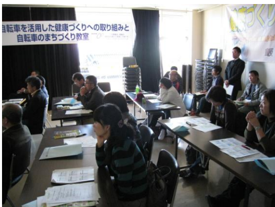
自転車を活用した健康づくりへの取り組みと自転車のまちづくり教室