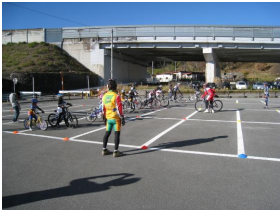
サイクリングの楽しみ方と自転車生活のすすめ教室