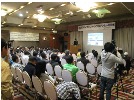
シンポジウム会場の様子