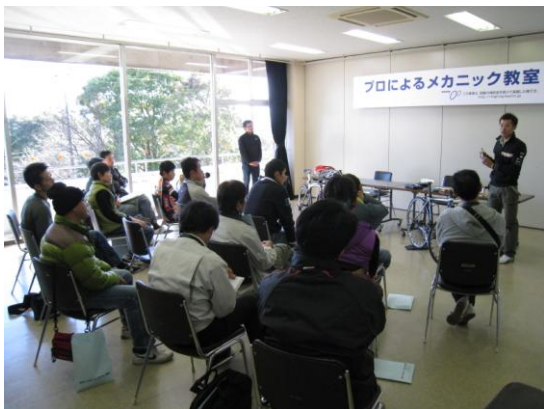
関連イベント／プロによるメカニック教室