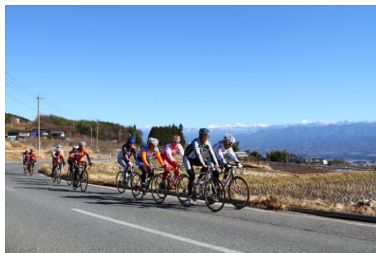
自転車選手とサイクリング