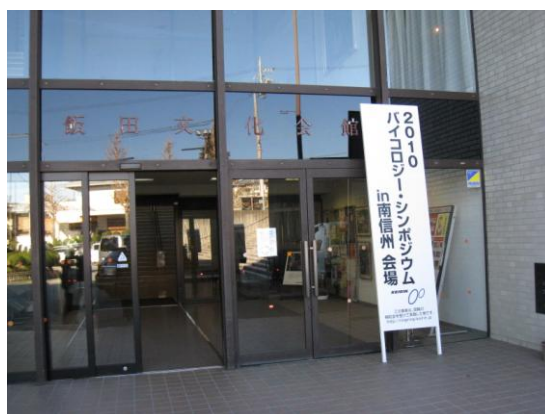
関連イベント入口看板（飯田文化会館）